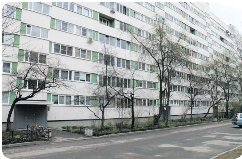
На фото дом после капитального ремонта фасада ул. Генерала Симоняка, д. 27